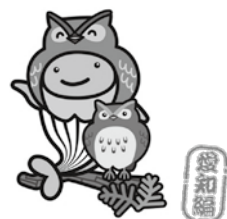
ご当地クーちゃん コハズクーちゃん

どがんすっと!」と言って仰天したとか。幸運の神様も抽せん前から堂々と当せん宣言されて、驚いてYさんに振り向いてしまったのかも…。