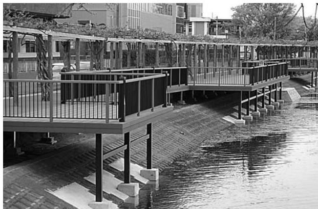
越谷市ウッドデッキ整備事業