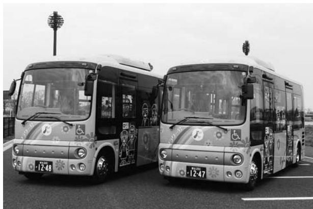
鴻巣市コミュニティバス購入事業