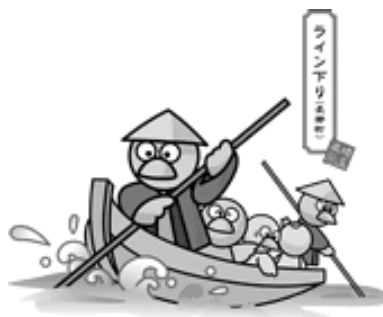
ライン下り（長瀨町）