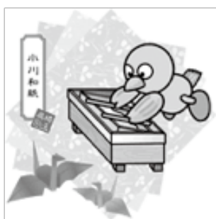
小川和紙（小川町、東秩父村）