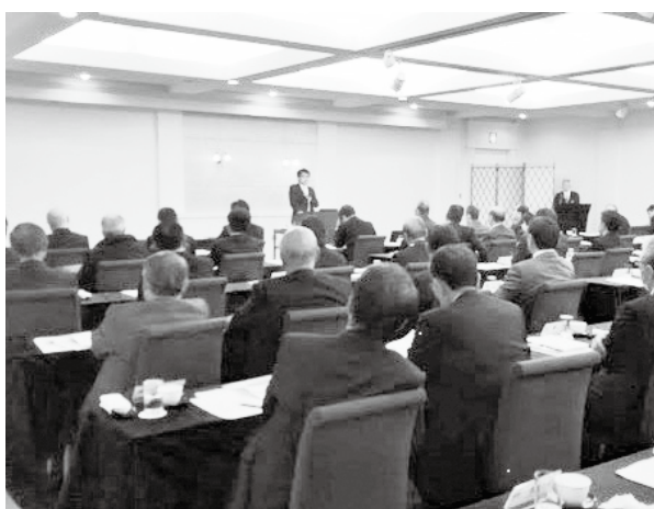
市町村トップセミナー