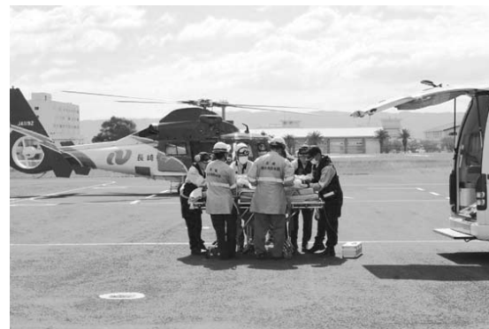
離島からの救急患者の搬送