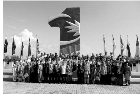
平成26年度中学生マレーシア交流事業（西海市）