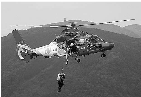
平成24年度に更新した防災ヘリ「ながさき」と救助訓練