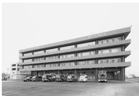
諫早消防署新庁舎建設事業（県央地域広域市町村圏組合）