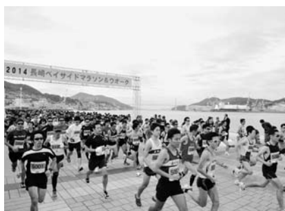
2014長崎ベイスайдマラソン&ウォーク （マラソンの部）（長崎市）