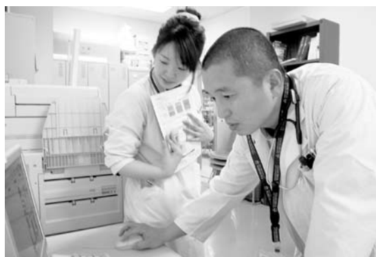
地域医療人材育成事業（平戸市）