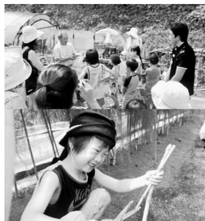
東そのぎの夏休み田舎暮らしプロジェクト 2014（東彼杵町）