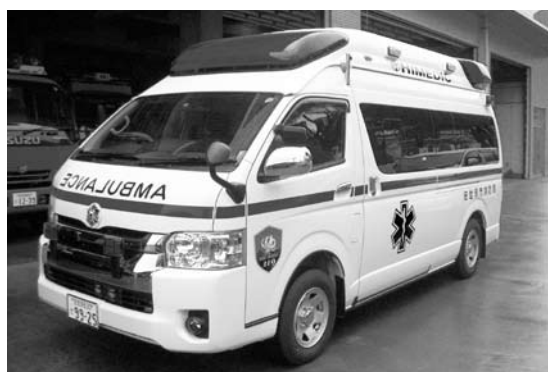
消防庁舎整備事業（佐世保市）