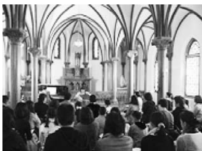
おぢか国際音楽祭実行委員会補助金 （小値賀町）