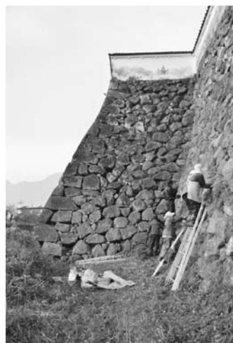
文化財経費（島原市）