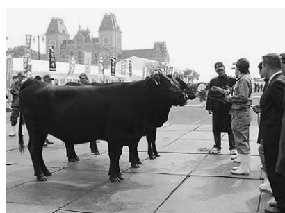
「長崎和牛」による交流人口拡大基盤 整備事業（川棚町）