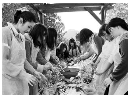
「定住への第一歩“女子旅”フェイスブック」 拡散PR事業（波佐見町）