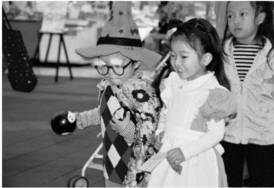
市民の国際化推進事業（諫早市）