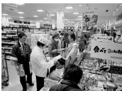
一次産品販売対策事業（松浦市）